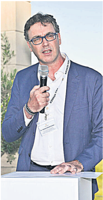
Vizeregierungschef Antoni Costa hielt bei der Eröffnung eine Rede.