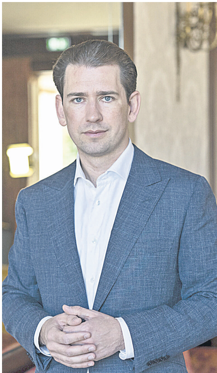
Österreichs Alt-Kanzler Sebastian Kurz im Castillo Hotel Son Vida.

„Alt-Kanzler“ und „Jung-Unternehmer“: Sebastian Kurz im Gespräch über Politik, die Nahost-Krise und Mallorcas Zukunft