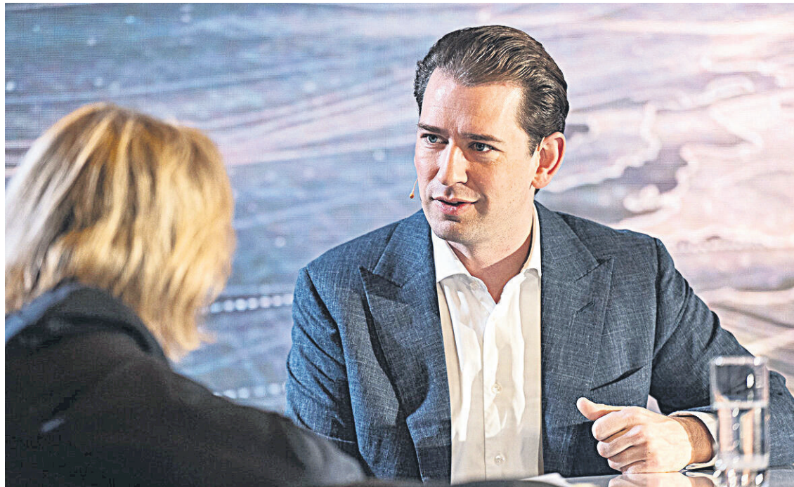
Österreichs Alt-Kanzler Sebastian Kurz (ÖVP) in einem Talk mit TV-Journalistin und Medienunternehmerin Sabine Christiansen. Nach seiner politischen Karriere arbeitet er nun als KI-Unternehmer im Nahen Osten.