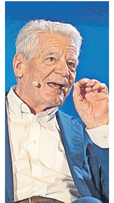
Der ehemalige Bundespräsident Joachim Gauck erhielt Standing Ovationen.