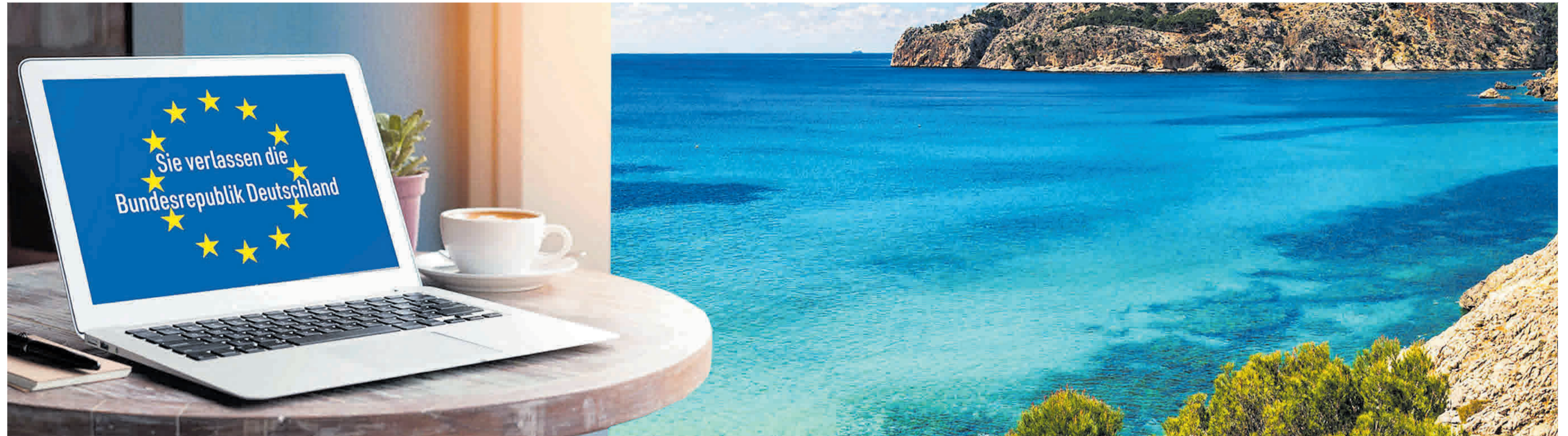
Für immer mehr Menschen ist eine physische Anwesenheit an einem realen Arbeitsplatz mit Schreibtisch in Deutschland nicht mehr notwendig. Doch im mediterranen Lebens- und Arbeitsumfeld geraten fiskalische Regelungen und Fallstricke des Zuzugslands leicht aus dem Blickfeld.

Um also zu verhindern, dass die Auswanderung zu einem „fiskalischen Großschadensereignis“ führt, haben sich die beiden führenden Steuerexperten zu einem gemeinsamen Projekt zusammengetan, bei dem sich nun die beiden Perspektiven ideal ergänzen sollen. Dabei geht es darum, die sehr